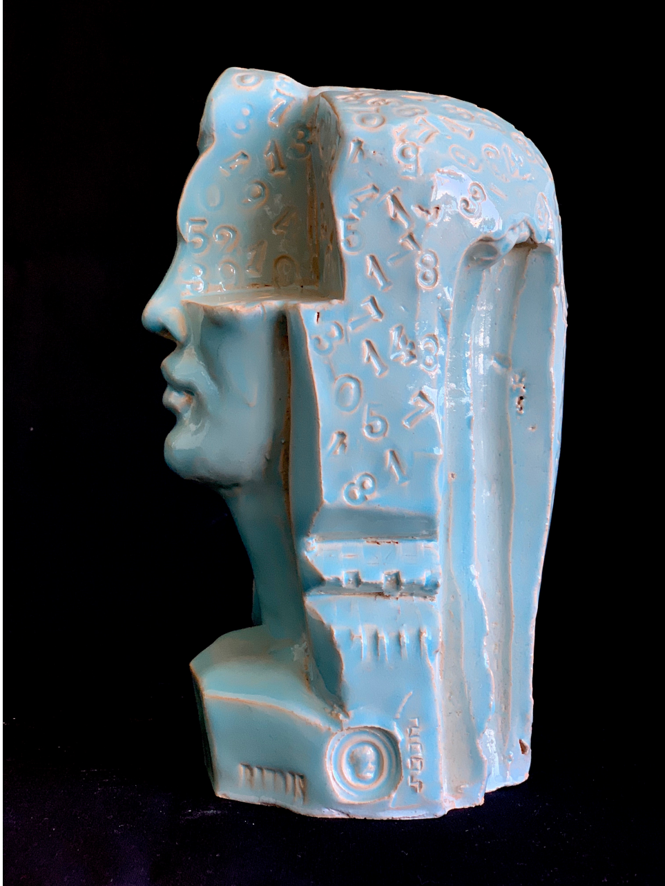
Terre cuite émaillé turquoise, pièce unique Hauteur : 23 cm