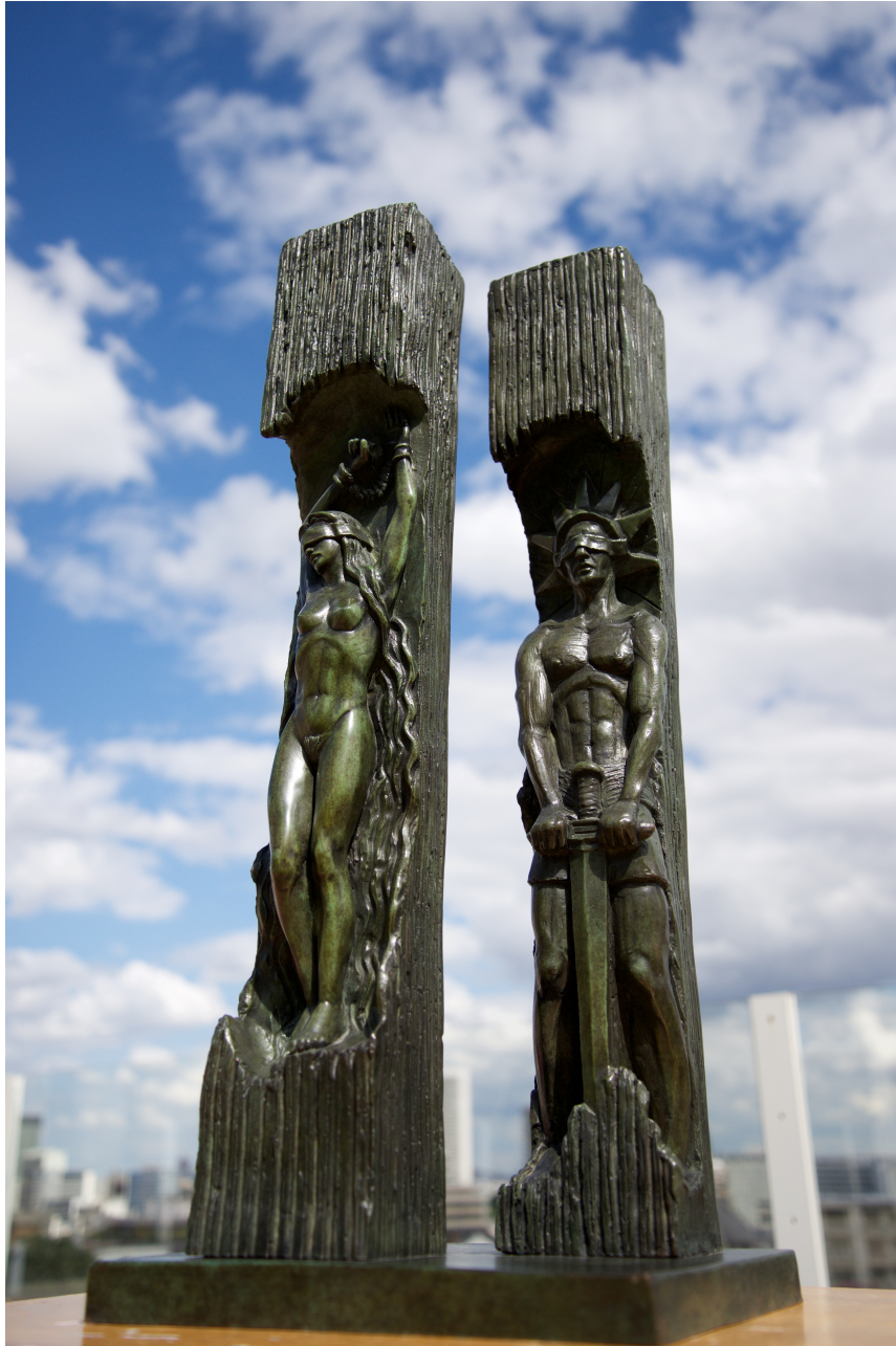
Bronze fonderie Paris Tirage 1/8 Hauteur : 70 cm

WORLD TRADE CENTER Hommage aux victimes du terrorisme, a parcouru plus de 16.000 km en Europe et au Canada. Ce bronze a été vu par des milliers de personnes et de nombreuses personnalités politiques Françaises, Suisses, Canadiennes et Américaines ont soutenu ce projet. Une copie est exposée dans les salons privés du Palais de l'Elysée et une autre à été inaugurée devant la caserne des pompiers à Puteaux. Elle est présente dans la galerie virtuelle du musée 9/11 à New-York.