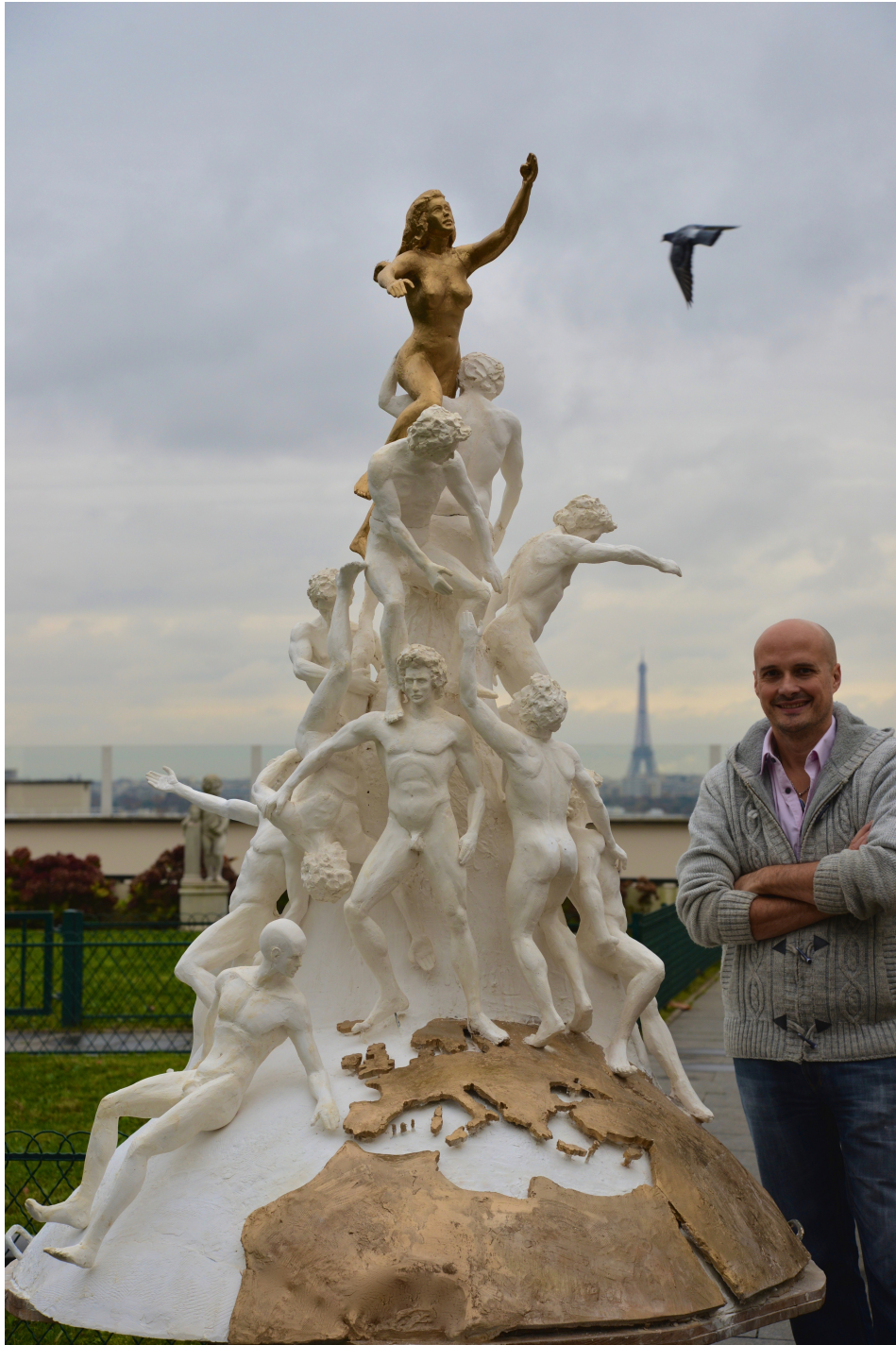
Plâtre armé, exemplaire unique Hauteur : 300 cm

UNION Pour une paix européenne, une fontaine monument symbole de mémoire et d'avenir des peuples européens. Cette sculpture monumentale représente une pyramide humaine au sommet de laquelle l'héroïne Europe d'un bras protège et de l'autre fixe un cap. Les 12 personnages représentent les étoiles du drapeau européen. L'oeuvre est interactive et évolutive, prenant en compte les origines gréco-romaines et celtiques du vieux continent.