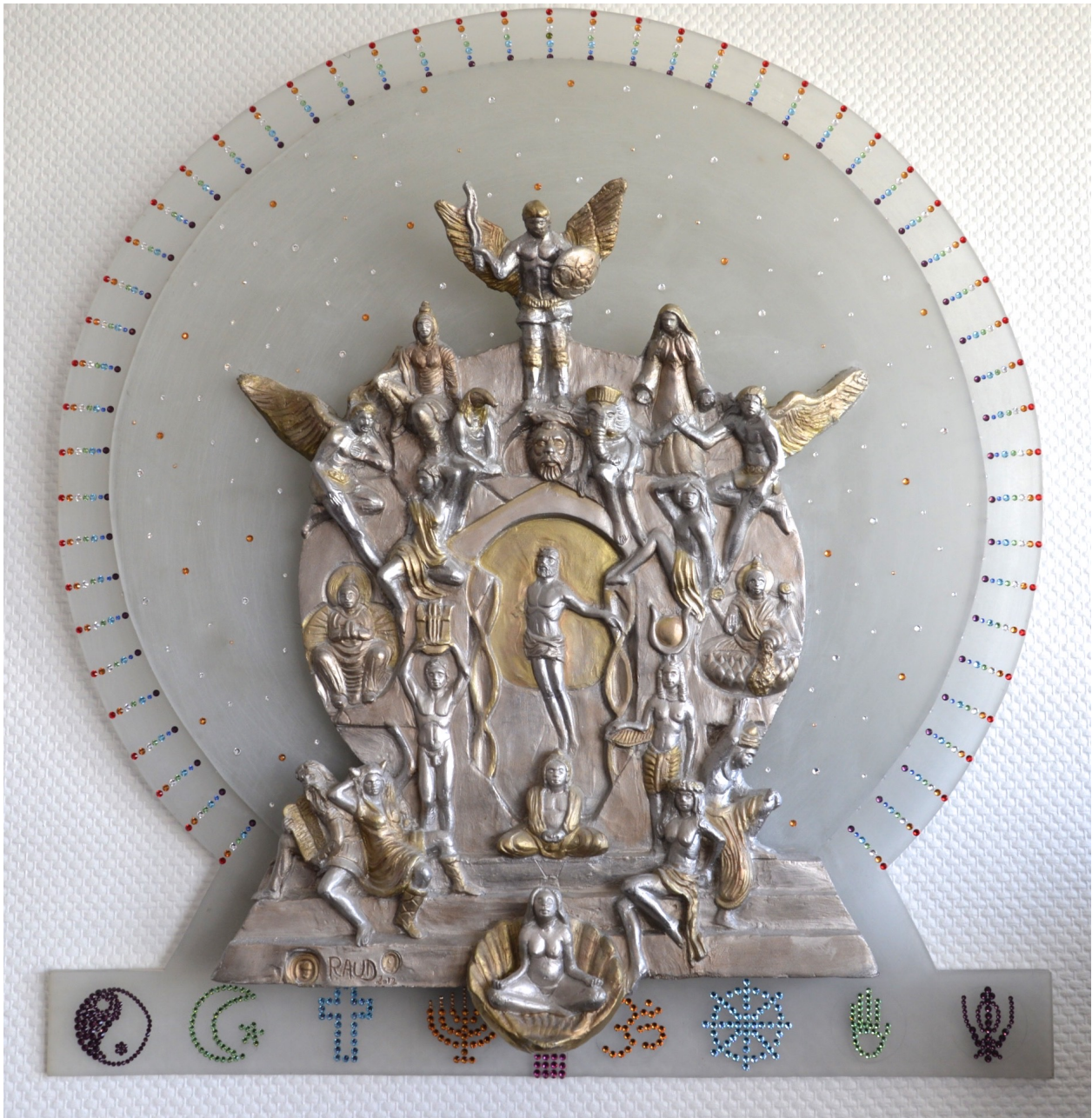
Plâtre , plexiglas et cristal, Pièce unique Hauteur : 60 cm

PORTE SPIRITUELLE Cette sculpture représente l'union des différents courants spirituels présents ou passés, à travers une porte de la foi s'ouvrant vers les aspirations spirituelles humaines. L'origine créative prend sa source dans l'oeuvre de Rodin et en particulier sa porte de l'enfer vers 1888 qui fait référence à la porte du Paradis de Ghiberti commencée vers 1425 au baptistère de Florence. A l'heure de la globalisation, cette oeuvre incarne une sorte d'oecuménisme universel. Si l'homme est religieux, Dieu est amour, quelque soit la forme qu'il ou elle prend.