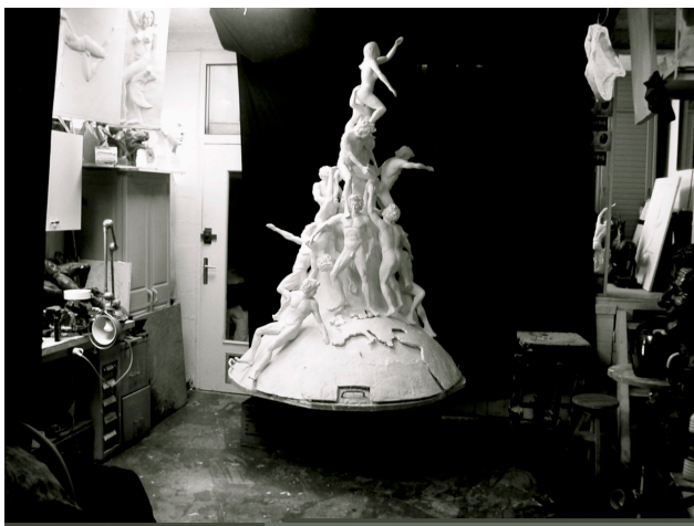
L'union, dans l'atelier de Drancy

Depuis la chute du Mur de Berlin en 1989, comme pour rebâtir le monde, Jean-Sébastien Raud compose les mémoires de nos traumatismes collectifs. A l'image d'Alina Szapocznikow qui modelait les visages sensuels de ses tumeurs pour mieux se les approprier. Car à l'heure pudibonde des sculptures rhabillées, le sculpteur engagé fait