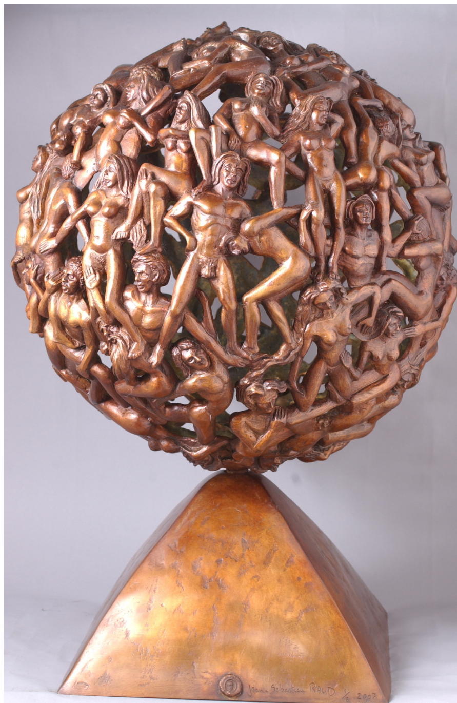
Bronze fonderie Paris Tirage 1/8 Hauteur : 80 cm

SPHERE Oeuvre sur la coopération internationale, sélectionnée par le secrétariat des Nations Unies, et exposée à la COP 21 à Paris en 2015 aux espaces génération climat du Bourget où elle a été présentée à Ségolène Royal, Ministre de l'écologie et du développement durable, et vue par des centaines de personnes représentant plus de 50 pays dans le monde, dont Jean-Pascal van Ypersele, Prix Nobel de la paix 2007 pour ses travaux sur les changements climatiques. Jean Sébastien Raud a également reçu un courrier de soutien du pape François pour son oeuvre.